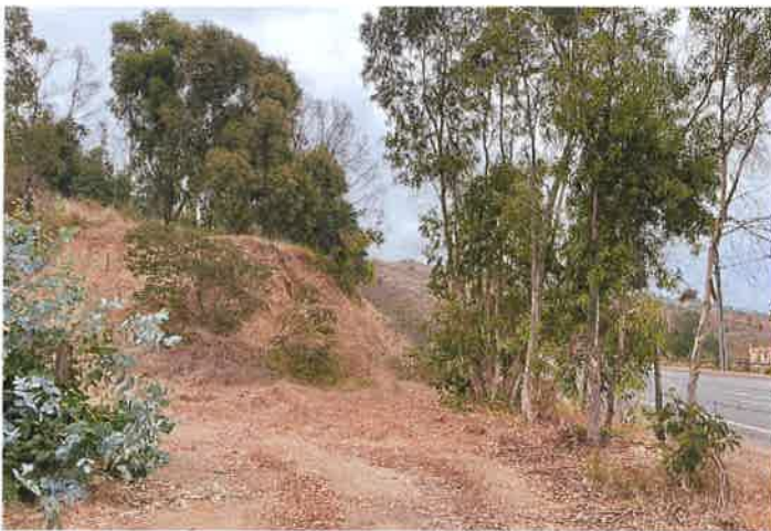
Visita a terreno fecha 4 de Marzo

Se hizo una visita a terreno para verificar la condición del terreno respecto a la ruta y conocer el diseño de la rambla que debe construir la INmobiliaria FUnDo Zapallar frente al proyecto.