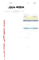
Screenshot_20240830_195633_Samsung Notes.jpg 296K