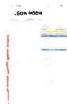
Screenshot_20240830_195633_Samsung Notes.jpg 296K