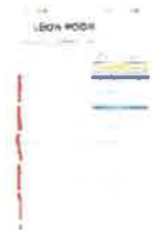
Screenshot_20240830_195633_Samsung Notes.jpg 296K