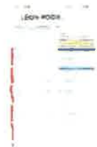
Screenshot_20240830_195633_Samsung Notes.jpg 296K