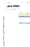
Screenshot_20240830_195633_Samsung Notes.jpg 296K