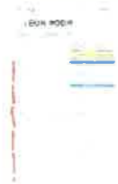
Screenshot_20240830_195633_Samsung Notes.jpg 296K