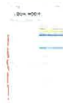
Screenshot_20240830_195633_Samsung Notes.jpg 296K