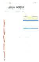
Screenshot_20240830_195633_Samsung Notes.jpg 296K