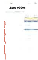
Screenshot_20240830_195633_Samsung Notes.jpg 296K