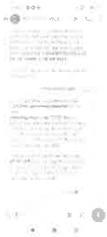
Cambio de hora operacion sra. Margarita Catalan.jpg 531K