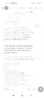
cambio de hora operacion sra. Margarita C..jpg 476K