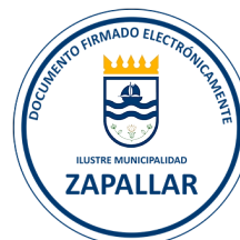
NICOLAS ROMO CONTRERAS Alcalde (S)