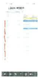
Screenshot_20240830_195633_Samsung Notes.jpg 296K