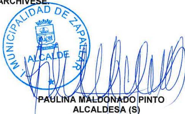
PAULINA MALDONADO PINTO ALCALDESA (S)