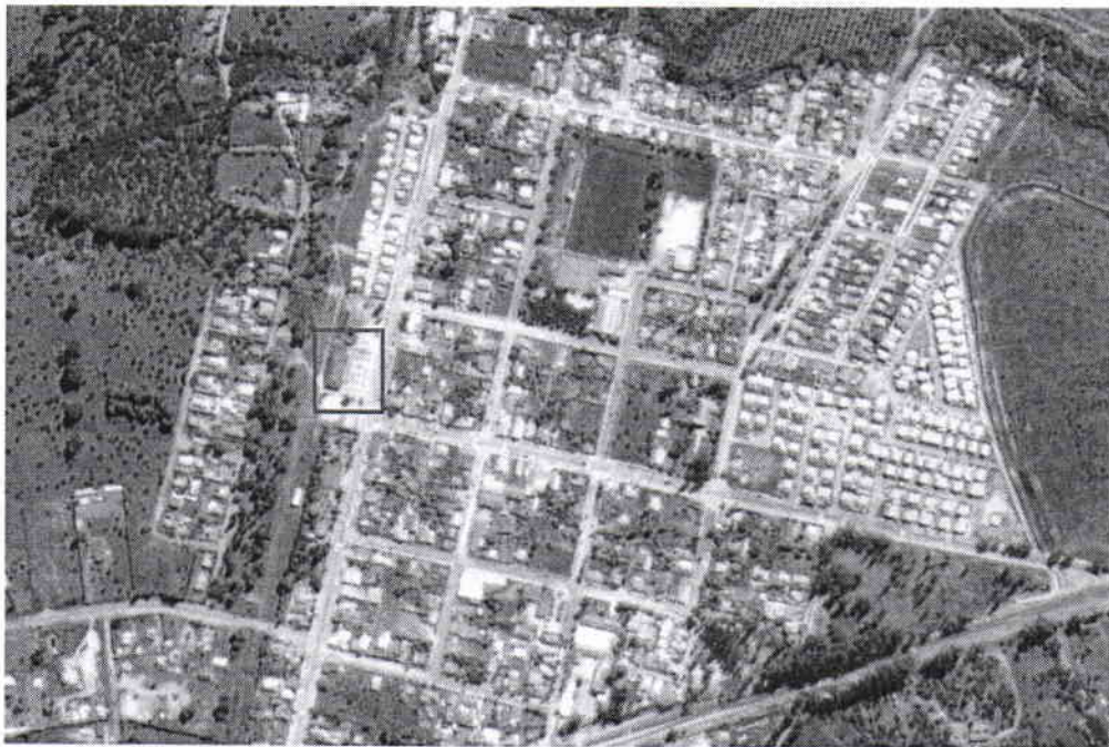
Imagen 1: Ubicación de la Estación "Esperanza" de Catapilco y Terreno emplazamiento proyecto.

El Centro Cultural y Comunitario de Catapilco se emplazará en los terrenos de la Estación de Catapilco, usando como base arquitectónica el actual edificio que allí se encuentra.