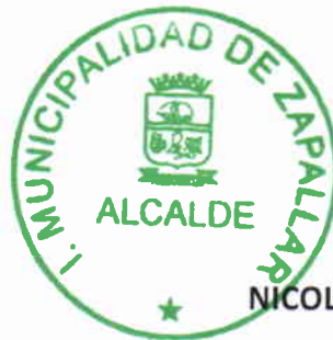
NICOLÁS COX URREJOLA ALCALDE