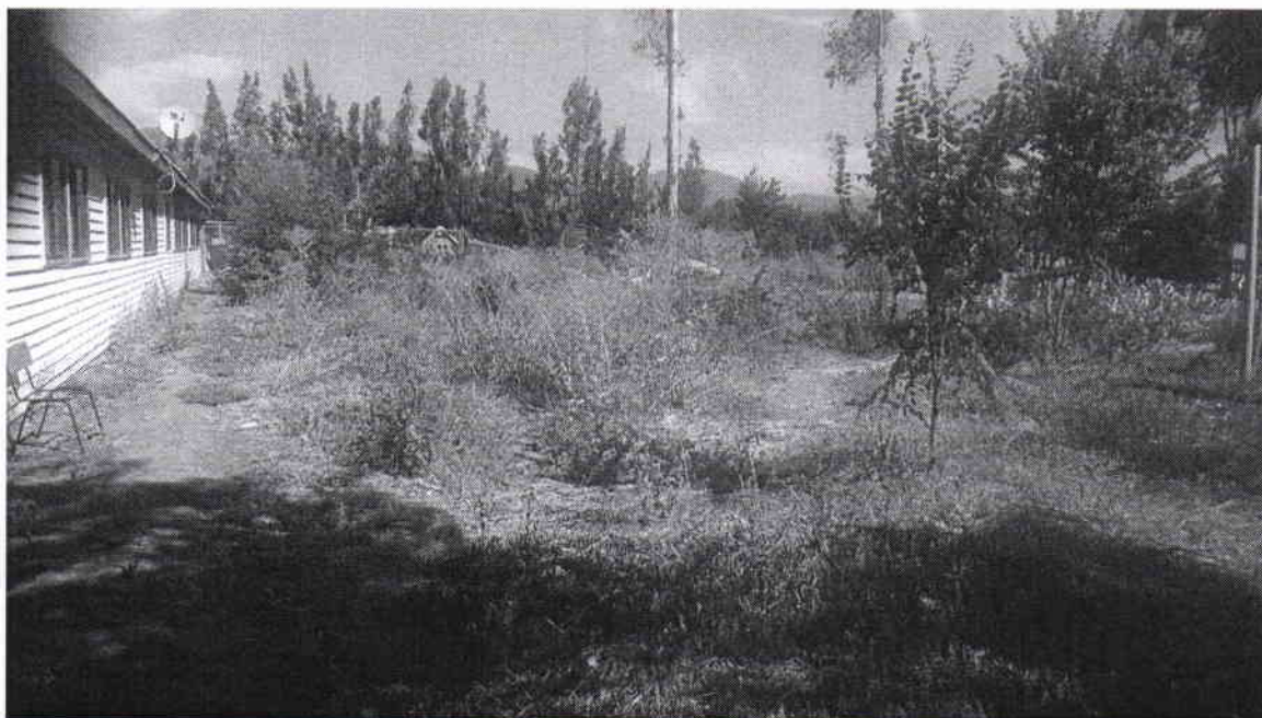
Figura nº2 Superficie de emplazamiento.

Se considera el despeje y limpieza del terreno en donde ira la planta generadora.