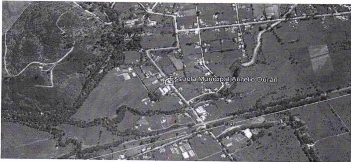
Figura N° 1: Ubicación del terreno de emplazamiento de la escuela Aurelio Duran.