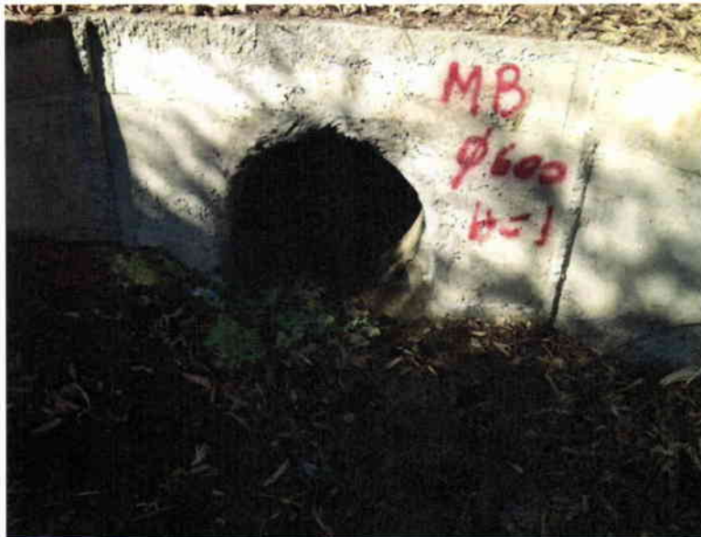
Figura 2: Zona donde se proyecta la construcción de nuevo zampeado de piedras.

La cama de hormigón seco de 225 Kgcem/m 3 y de 10 cm. de espesor, se apoyará sobre el terreno en cuestión, debidamente consolidado. Se incluye el suministro de piedra de tamaño adecuado y en apoyo, la provisión del mortero de pesa, su ejecución, la limpieza final y cualquier otra actividad necesaria para conseguir una buena ejecución de la obra.