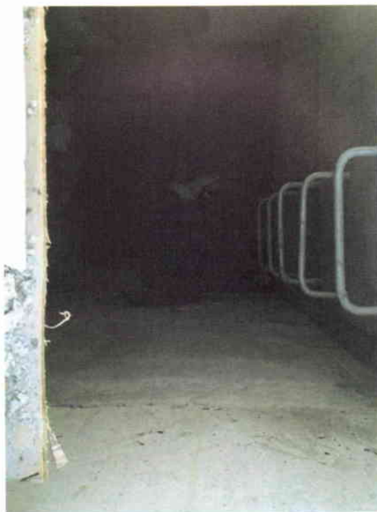
Figura 4: Estado actual de cámaras de colector aguas lluvias

República de Chile I. Municipalidad de Zapallar Secretaría Municipal