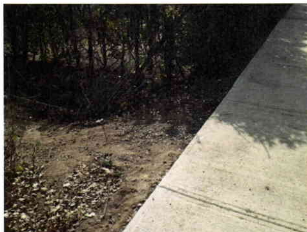
Figura 1: Canal existente a rehabilitar

El proyecto considera la recolección de las aguas lluvias provenientes de los pasajes interiores y verterlas al colector principal, por medio del empleo de una aceque revestida en hormigón existente en terreno. Previo a la conexión se deberá velar por la correcta limpieza y reparación de esta aceque, ya que actualmente se encuentra con bastante basura y escombros, los cuales deben ser retirados y además reparar todo hormigón con grietas o enfierradura a la vista.