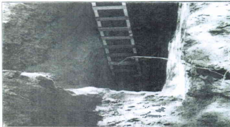
Imagen N° 1: Calicata N°1.