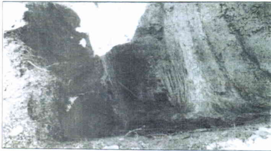
Imagen N° 2: Calicata N°1.

JPM Ingeniería Estructural Araucó 525, Oficina 4 - Quiloto TEL: 56 9 9400 8200