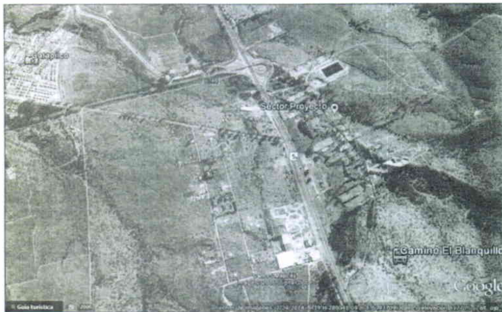
Figura 1: Croquis de Ubicación

El terreno abarca una superficie neta total de 2.266,76 m 2 .