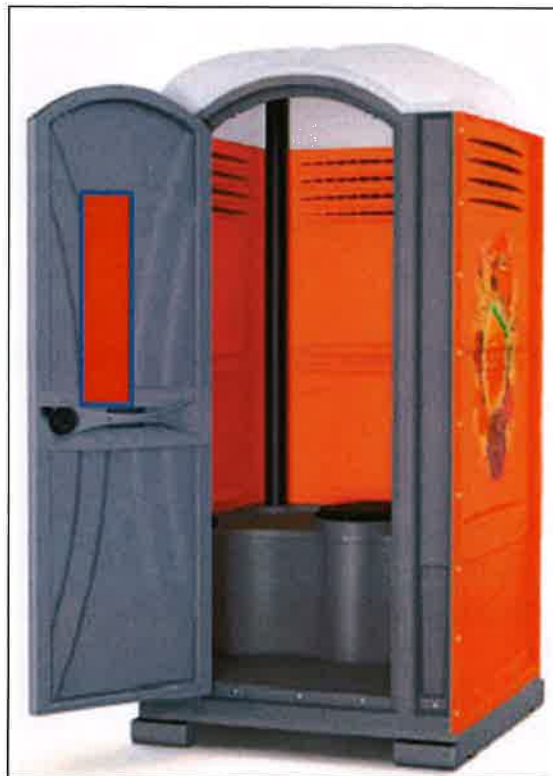
FOTO REFERENCIAL DE BAÑO QUIMICO