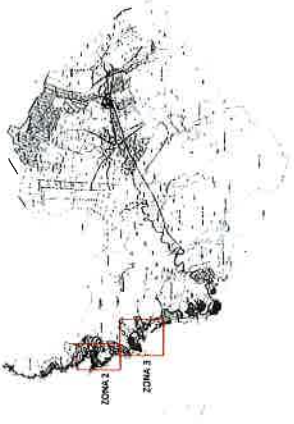
PLANO COMUNA ZAPALLAR S/E