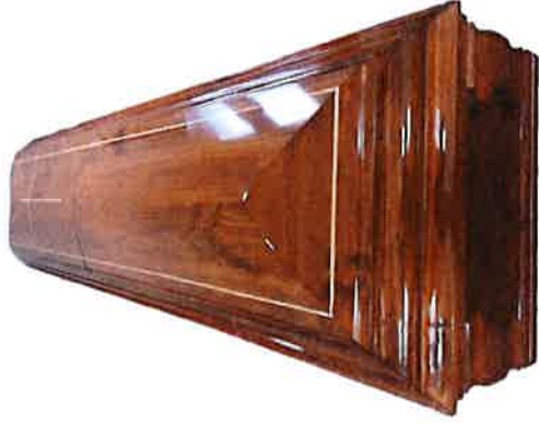
* Imagen referencial puede variar diseño, color y barniz*