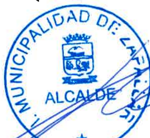
GUSTAVO ALESSANDRI BASCUÑAN Alcalde