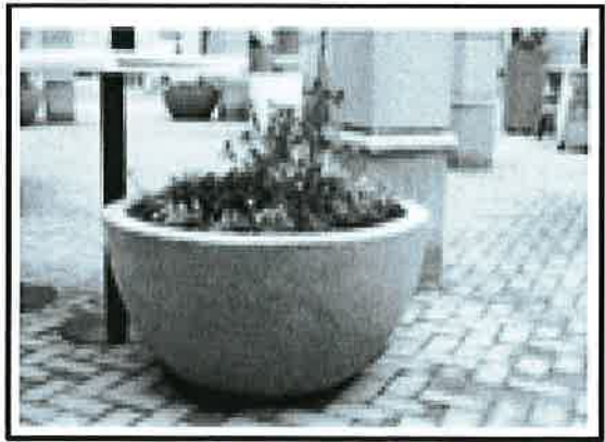
Macetas de piso