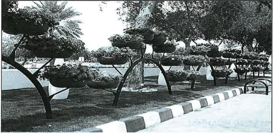
Macetas en estructura metálica