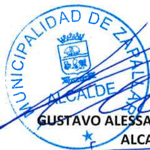
GUSTAVO ALESSANDRI BASCUÑÁN ALCALDE