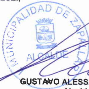
GUSTAVO ALESSANDRI BASCUÑAN Alcalde