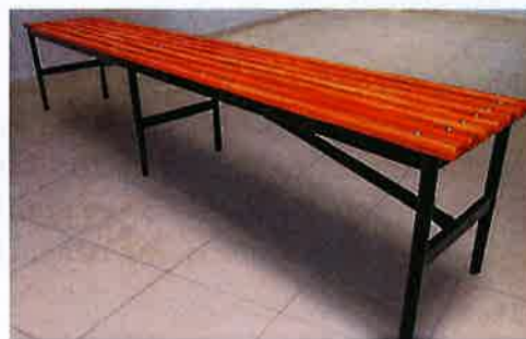
Modelo asiento de camarín simple, referencial

Recepción de trabajos con V°B° de la ITO.