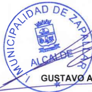
GUSTAVO ALESSANDRI BASCUÑAN Alcalde