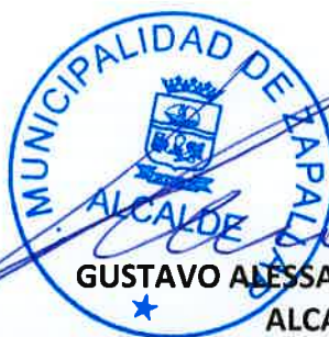
GUSTAVO ALESSANDRI BASCUÑÁN ALCALDE