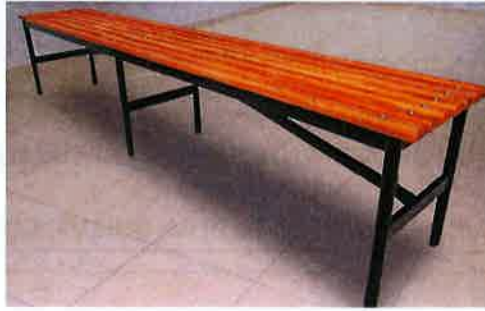
Modelo asiento de camarín simple, referencial