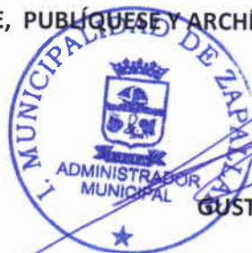
GUSTAVO ALESSANDRI BASCUÑÁN ALCALDE