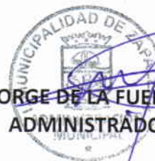
JORGE DE LA FUENTE SEPULVEDA ADMINISTRADOR MUNICIPAL