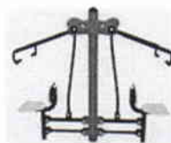
Maquina hercules espalda-hombros