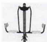
Prensa piernas doble