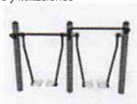
Caminador aereo doble

República de Chile I. Municipalidad de Zapallar Adquisiciones y licitaciones