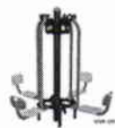
Prensa piernas 4 personas