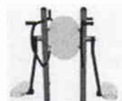
Maquina pendular + abdominales + brazos