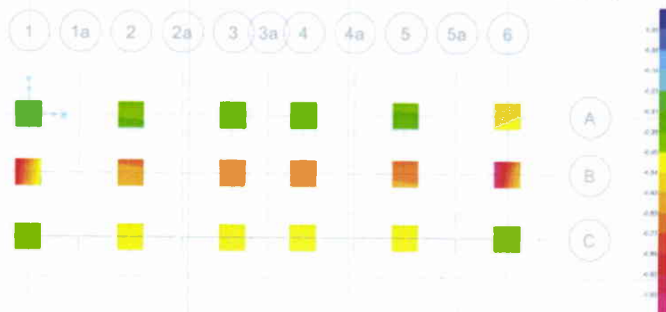
Vista en planta Fundaciones, Presiones admisibles más desfavorables [kgf/m 2 ]

Se definen las dimensiones de las zapatas a partir del control de las presiones admisibles del suelo planteadas al inicio, para la combinación de carga más desfavorable, así como una revisión del asentamiento permisible.