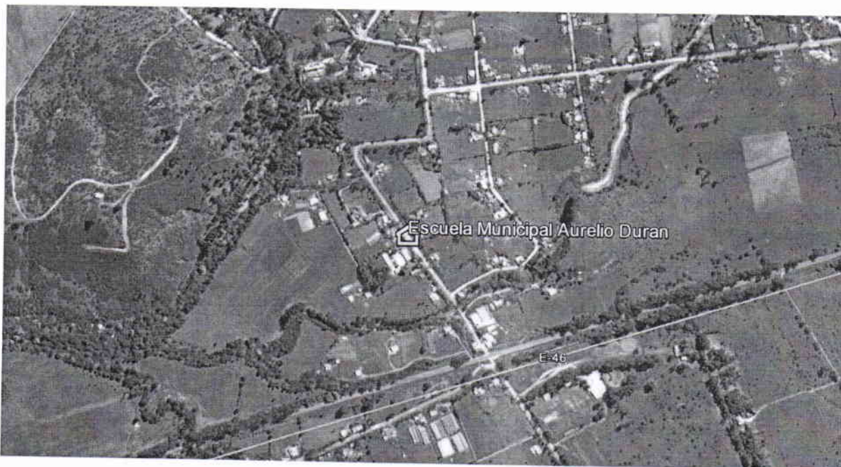
Figura1: Ubicación del Terreno de Emplazamiento de la Escuela Aurelio Duran

La Escuela Aurelio Duran se ubica en la ruta E-451, sector la hacienda de Catapilco, localidad de Catapilco en la comuna Zapallar. La siguiente fotografía muestra la ubicación del proyecto: