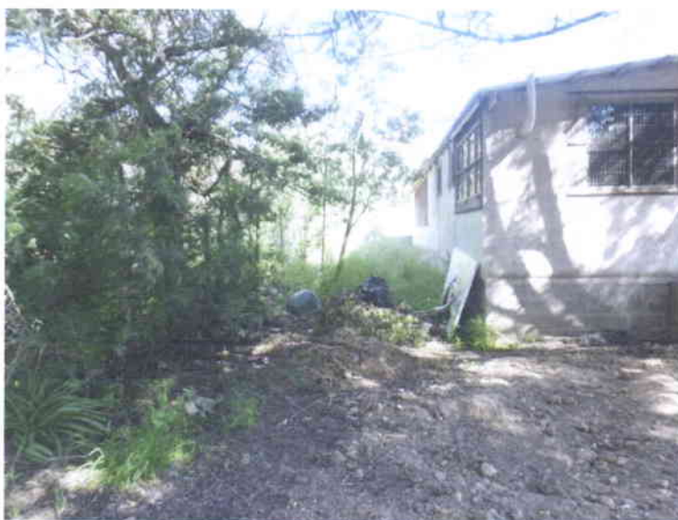
Retiro de árboles existentes ubicados en cierre perimetral lateral oriente.