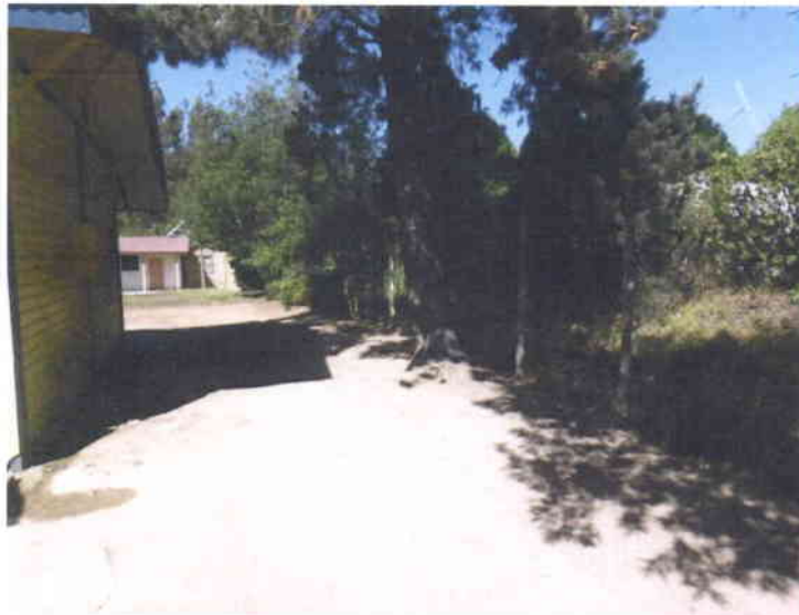
Retiro de árboles existentes ubicados en cierre perimetral lateral sur.