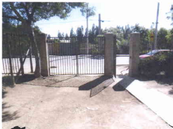
Puerta y Portón de Acceso Existentes a Demoler.

Todo desecho y escombro será retirado y depositado en un vertedero autorizado, siendo de cargo y responsabilidad del contratista la totalidad del proceso. El transporte contará con todas las precauciones a fin de no producir polvos o desprendimientos de material de cualquier tipo. La empresa deberá poner a disposición de la unidad técnica, la calendarización de las faenas de modo de que la demolición de las mismas, se efectúe en el momento oportuno. La comunicación deberá efectuarse por escrito y constar en el Libro de Obras.