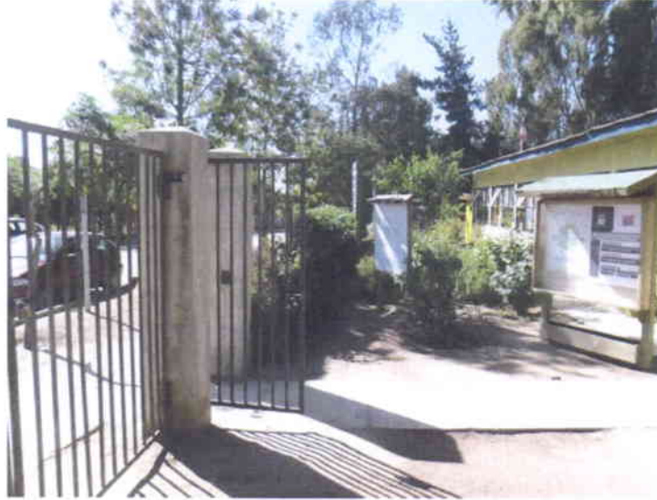
Puerta y Portón de Acceso Existentes a Demoler.

República de Chile I. Municipalidad de Zapallar Secretaría Municipal