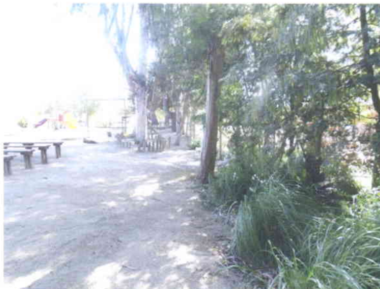
Retiro de árboles existentes ubicados en cierre perimetral lateral norte.

República de Chile I. Municipalidad de Zapallar Secretaría Municipal