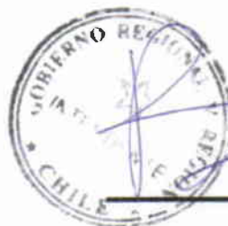
RICARDO BRAVO OLIVA INTENDENTE REGIONAL GOBIERNO REGIONAL VALPARAÍSO