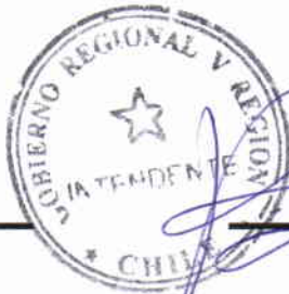
RICARDO BRAVO OLIVA INTENDENTE REGIONAL GOBIERNO REGIONAL VALPARAÍSO