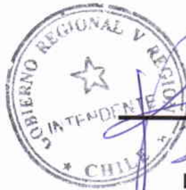
RICARDO BRAVO OLIVA INTENDENTE REGIONAL GOBIERNO REGIONAL VALPARAÍSO