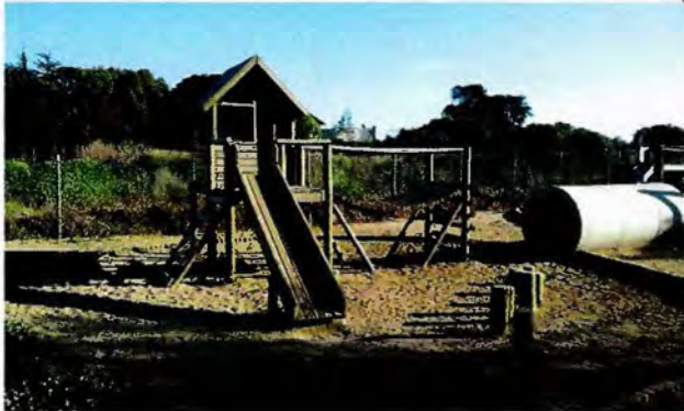
Foto N°1: Se identifican los juegos prefabricados correspondientes a la Casa Tobi y culebra.