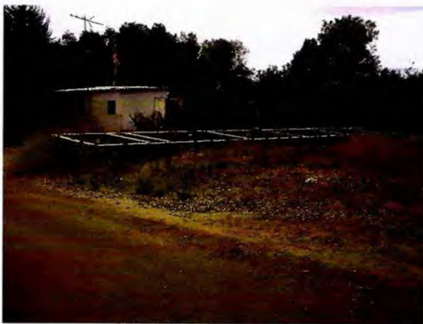
Foto 13.-Estructura metálica de la techumbre portal, ubicada en un bien nacional de uso público según lo señalado en el Informe Final N°4, de 2012.