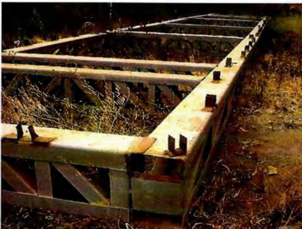
Foto 14.-Estructura metálica del portal, ubicada en un bien nacional de uso público según lo señalado en el Informe Final N°4, de 2012.