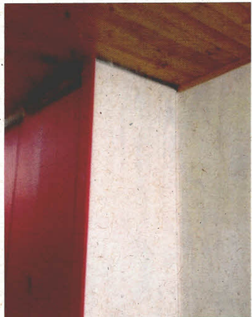
Imagen N° 4: Falta instalar moldura parte superior.