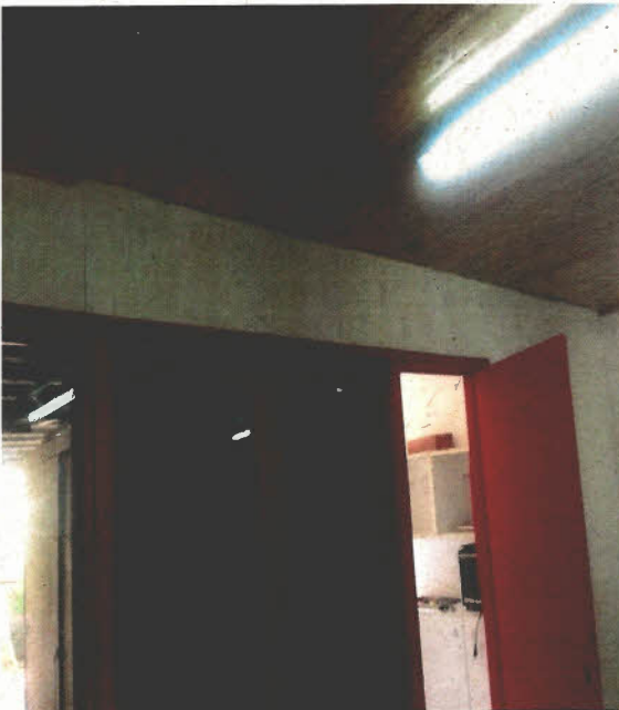
Imagen N° 3: Falta instalar moldura parte superior derecha.