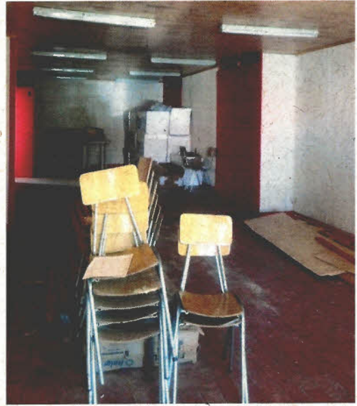
Imagen N° 2: Dependencia desordenada, sin limpiar y material sobrante.