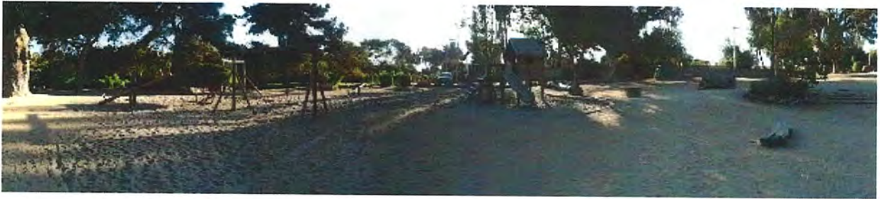
Foto N°1: Se observa la existencia de los siguientes juegos infantiles en la Plaza chachagua: Casa Tobi, 2 columpios y 2 balancines.

Fotos N°s 2, 3 y 4: Inexistencia de "Luminaria Mistral" -4 unidades- en obra "Reparación e Iluminación Pasarela El Blanquillo y Área Colindante. Solo se observan la 9 "Luminarias Urban". La obra incluyó el mejoramiento del puente, cierre perimetral y veredas.