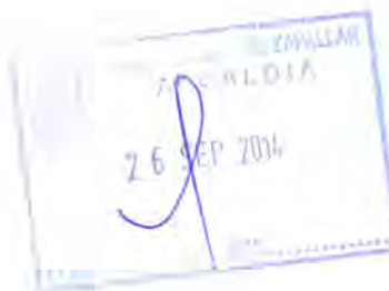
RICARDO PROVOSTE ACEVEDO Contralor Regional Valparaíso CONTRALORÍA GENERAL DE LA REPÚBLICA