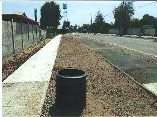
Foto N° 8: La calzada no contempla la red de regadío propuesta (válvulas de conexión para manguera).