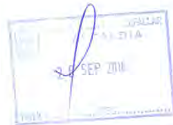
RICARDO PROVOSTE ACEVEDO Contralor Regional Valparaíso CONTRALORÍA GENERAL DE LA REPÚBLICA