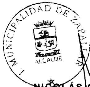
NICOLÁS COX URREJOLA