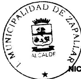
NICOLAS COX URREJOLA Alcalde

C: SI: CPLA 2013 / Aprueba Bases y Llamado Propuesta N°08/2013