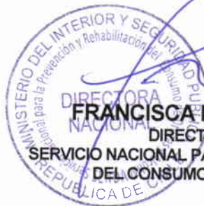
FRANCISCA FLORENZANO VALDÉS DIRECTORA NACIONAL SERVICIO NACIONAL PARA LA PREVENCIÓN Y REHABILITACIÓN DEL CONSUMO DE DROGAS Y ALCOHOL