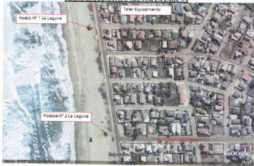
PLANO ESQUEMÁTICO SECTOR LA LAGUNA