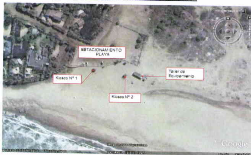
PLANO ESQUEMÁTICO SECTOR PLAYA CACHAGUA